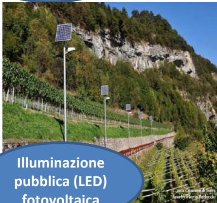
Illuminazione pubblica (LED) fotovoltaica