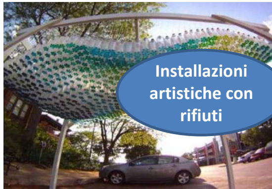
Installazioni artistiche con rifiuti