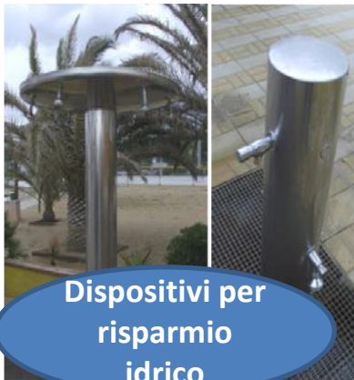
Dispositivi per risparmio idrico