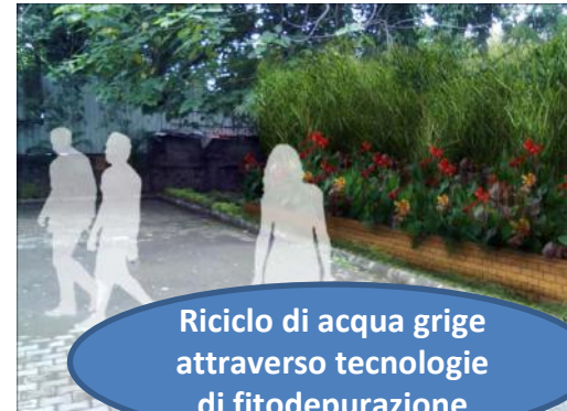
Riciclo di acqua grige attraverso tecnologie di fitodepurazione