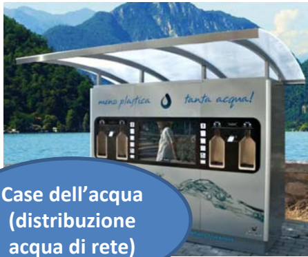
Case dell'acqua (distribuzione acqua di rete)