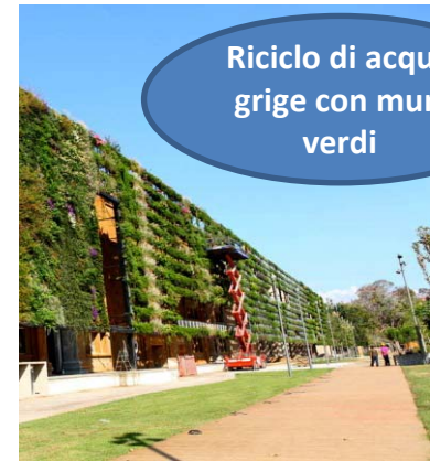
Riciclo di acque grige con muri verdi